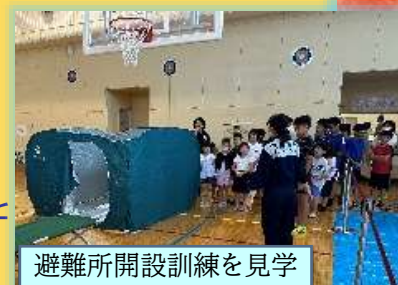
避難所開設訓練を見学

今年は各地で地震などの災害が起こっています。ご家庭でも、いざという時の備えをお忘れなく!