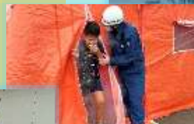
たくさんのご来賓が参観