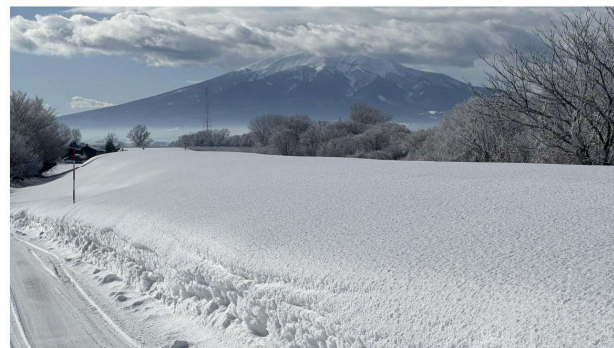
私の実家の裏にある土手と岩木山。冬季は除雪しない通行不可区間で手つかずのため、降り積もった雪の量が分かる。2日続けて気温が高かったため、だいぶ減った状況だったが、それでも1m弱はありそうだった。【令和7年1月11日11時頃撮影】

と記載していたんですが、降雪量（積雪量）が多い説は見事に当たりましたね。特に津軽地方は、ものすごいことになっています。幹線道路はそれなりに除雪されていますが、1歩住宅街に入るとそうでもありません。いつもは車が楽にすれ違えることができる道幅が、道路脇の除雪山によって、車1台がやっと通れるまでに狭まりました。対向車が現れると、どちらか一方が少し広めの所や交差点で待つこととなります。千歳平地区の雪も、例年より多いとのことですが、全国ニュースで連日「災害級の大雪」と報道された津軽地方で年末年始を過ごした私には、千歳平地区の雪はまだ少ない方だと感じさせるほどの、異常なまでの降雪量（積雪量）なのです。