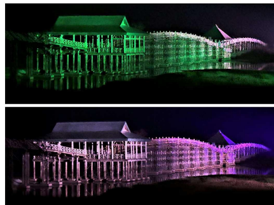
鶴田町にある『鶴の舞橋（ライトアップ）』。津軽富士見湖の兩岸を結ぶ全長300メートル、総七バ造りの三連太鼓橋（現在、大規模改修中）。緑と紫の2色が交互に照らしていました。残念ながら、ライトアップは11月4日で終了しています。機会がありましたら、来年どうぞ！ [令和6年10月27日 19時半頃撮影]

その前に、まずは健康でいることが大前提です。だいぶ寒くなってきましたので、かぜ（病気）・けが・事故には十分に気を付けさせてほしいところです。